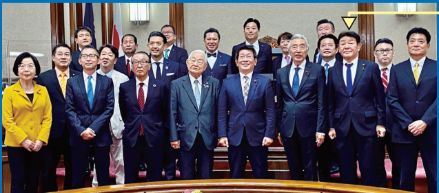
自民党名古屋市議員団