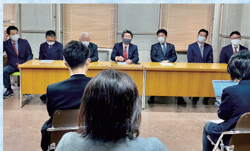
自民党名古屋市議員団役員改選 記者会見の様子(2021年4月27日)