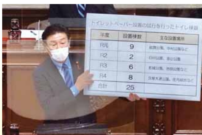
パネルにて説明する松井よしのり議員