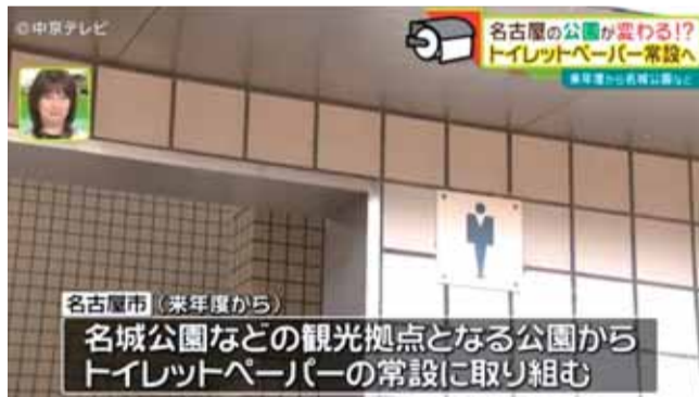
▲名古屋の公園が変わる!? トイレトペーパー常設へいたずらや盗難防止の対策も