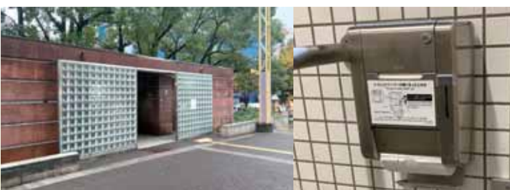
盗難防止対策として一部公園にて金属製の鍵付きペーパーホルダー設置済み

今後の公園トイレにおけるトイレトペーパーの設置につきましては、既に設置している公園に加え、まずは、名城公園など観光拠点となる公園や、野球場をはじめとする有料公園施設がある公園などを対象に、令和5年度からの本格実施に向けて取り組んでまいります。